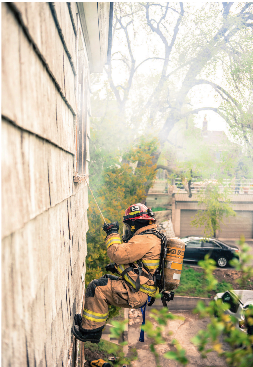
Window evacuation training by Salt Lake City Fire Department, Utah, USA.